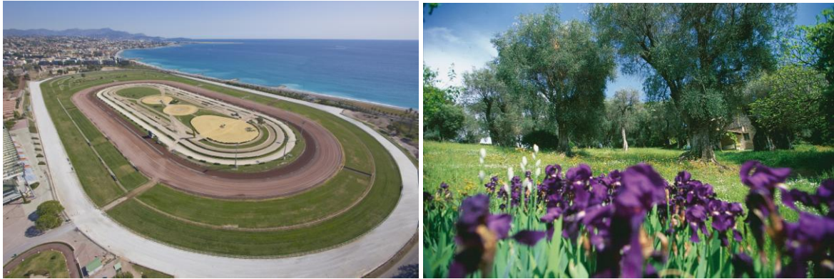
@ Hippodrome de Cagnes sur Mer- Photothèque CRT Riviera + Domaine des Collettes – Photo : OT de Cagnes

Contact Presse : Office du Tourisme - Jean-Marc Nicolai – Tel : 04 93 20 61 64