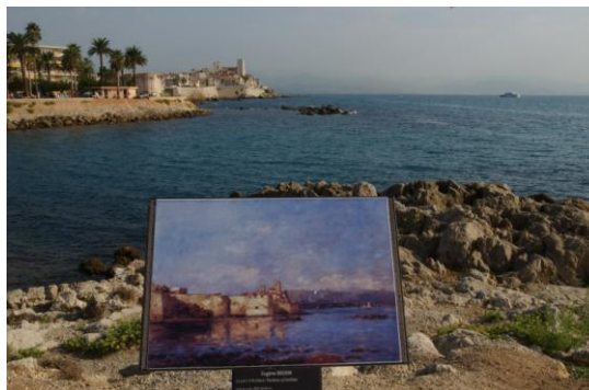
@ Musée Picasso - J.L Andral – Côte d'Azur des Peintres les Remparts - G. véran

Antibes Juan-Les-Pins a l'accent et les couleurs de Provence, mais aussi les folies de la Côte d'Azur, la somptuosité des parcs à l'anglaise, la blondeur des plages... Elle est ville de marins et de jardiniers, d'amoureux de Mozart et de Ray Charles, d'amateurs d'art. « La seule de toutes les villes de la Côte qui ait si bien gardé son âme » , disait Graham Greene.